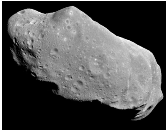
Figura 3. Asteroide 243 Ida.

seguintes: da aproximação feita nas integrais F_\alpha e F_\beta que compõe a equação (9); da incerteza na medição da densidade de massa; da aproximação feita na distribuição de massa, aproximação observada comparando as Figuras 3 e 4. Levando em conta estas observações, podemos concluir que o asteroide Ida é um ETHE.